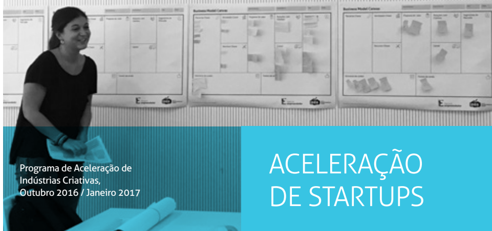
Programa de Aceleração de Indústrias Criativas, Outubro 2016 / Janeiro 2017

CENTRO DE INOVAÇÃO MOURARIA CREATIVE HUB